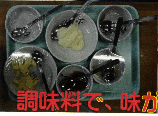
調味料で、味が変わるね！