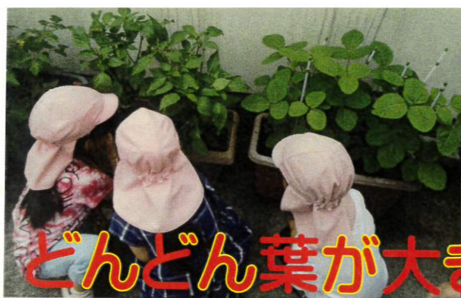
どんどん葉が大きくなってきたね！