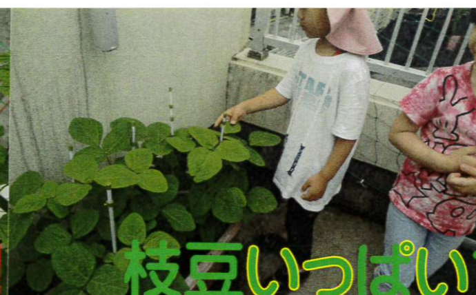
枝豆いっぱいできてるね！