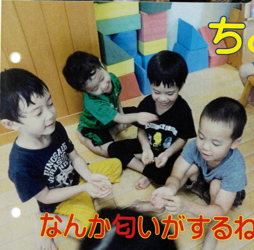
なんか匂いがするね！